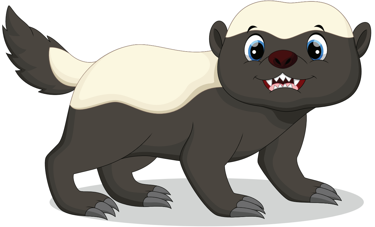
Piti (Bal Porsuđu)